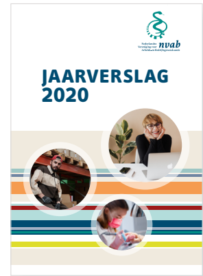
... of het volledige jaarverslag