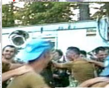
2000 WEDNESDAY THE NEW YORK TIMES