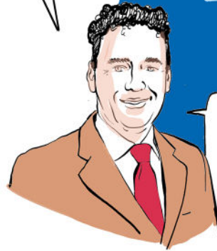
STAN KAAATJE DG WERK MIN SZW

ONGEMAKKELIJKE WAARHEID: LATEN WE VROUWGERELATEERDE ZIEKTES SERIEUS NEMEN